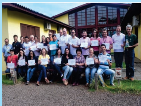
Capacitação sobre Homeopatia