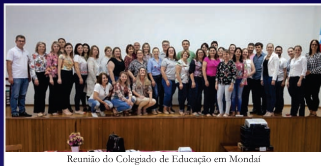
Reunião do Colegiado de Educação em Mondai

Para fortalecer o trabalho conjunto dos municípios a AMEOSC fomenta a criação de colegiados, além de fornecer assessoria permanente, colaborando com o fortalecimento da gestão pública e auxiliando no debate e encaminhamentos de ações coletivas. Assim, as informações são mais rápidas e uniformes. Atualmente, a entidade conta com 19 Colegiados, que neste ano de 2018, realizaram mais de 50 reuniões, com um total geral de 800 participantes.