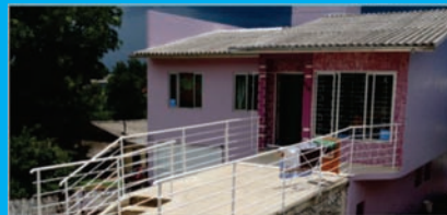
Casa de Apoio - Nova sede

Os Municípios do Extremo Oeste de Santa Catarina, através da AMEOSC, prestam apoio e auxílio financeiro mensal ao Instituto Terezinha Gaio Basso - Casa de Apoio, a qual presta serviço de hospedagem de familiares e amigos de pacientes atendidos no Hospital Regional de São Miguel do Oeste. Para a AMEOSC, é gratificante colaborar e ajudar a sociedade em geral, e por este motivo é parceira do Instituto Terezinha Gaio Basso - Casa de apoio.