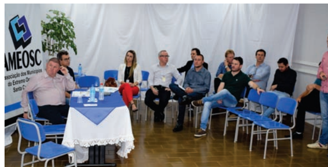
11 de outubro de 2018