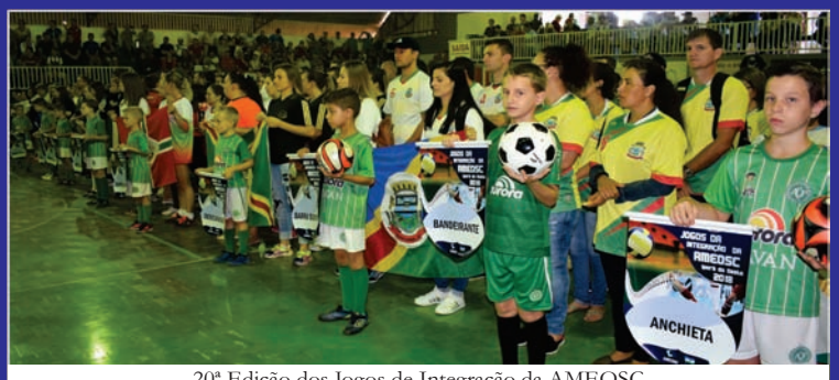
20ª Edição dos Jogos de Integração da AMEOSC