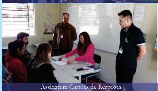
Assinatura Cartões de Resposta