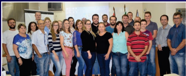
Reunião do Colegiado de Tributação