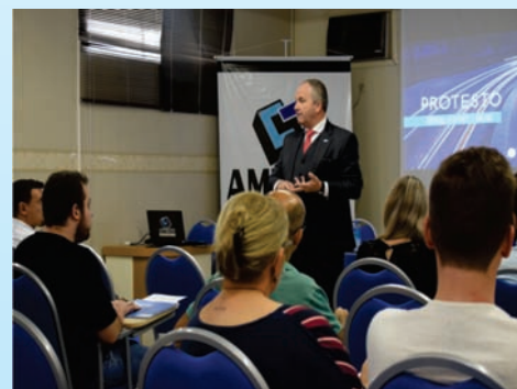
Capacitação sobre Protesto