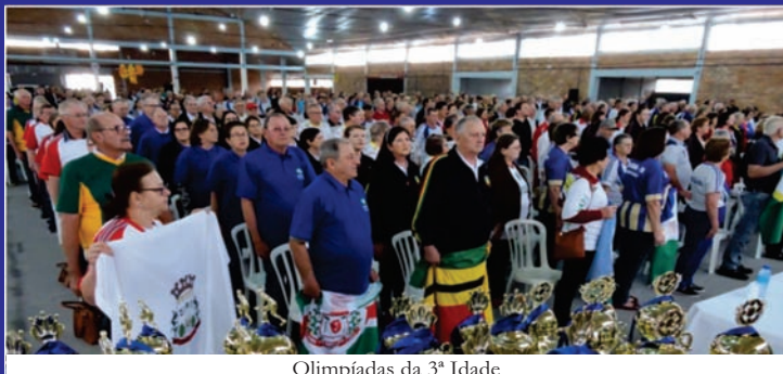
Olimpíadas da 3ª Idade