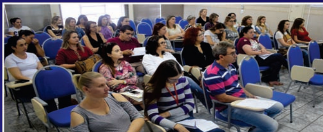
Reunião do Colegiado de Assistentes Sociais