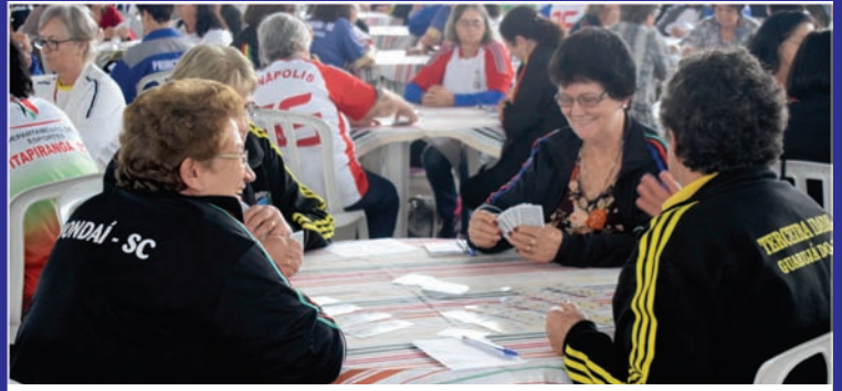
Olimpíadas da 3ª Idade

Visando promover a integração social e incentivar a prática sadia do esporte, objetivos elencados no planejamento estratégico da entidade, a Associação dos Municípios do Extremo Oeste de Santa Catarina (AMEOSC), realizou neste ano de 2018, diversas competições esportivas. Os jogos, contam com o apoio do Colegiado de Esporte da entidade e envolvem competidores dos 19 municípios de sua abrangência. Confira as competições esportivas realizadas: 2ª Copa AMEOSC de futebol (Sub 15 e 17 – Masculino); 1º Campeonato AMEOSC de bocha – Feminino e Masculino; 1ª Copa AMEOSC de Bolão 23 – Feminino e Masculino; 1ª Edição das Olimpíadas da 3ª Idade da Região da AMEOSC; 20ª edição dos Jogos de Integração da AMEOSC.