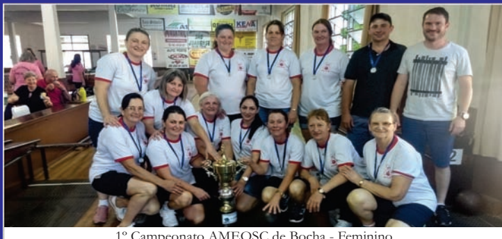
1º Campeonato AMEOSC de Bocha - Feminino