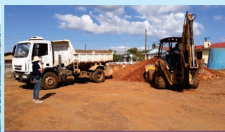
Filmagens da Prova Prática