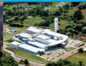
Hospital Regional Terezinha Gaio Basso Foto: 03/2011 - www.hrtgb.org