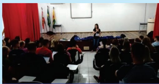
Treinamento dos Fiscais

O Departamento de Concursos da AMEOSC ressalta que se coloca à disposição dos Municípios para atendimento, sempre que necessário.