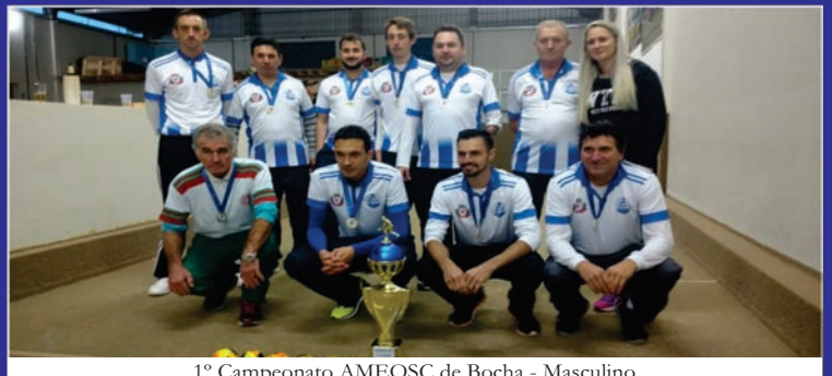
1º Campeonato AMEOSC de Bocha - Masculino