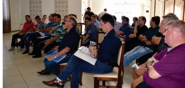
18 de dezembro de 2017, eleição da nova diretoria.