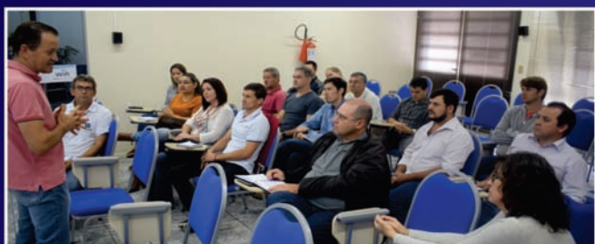
Reunião do Colegiado de Departamento Técnico