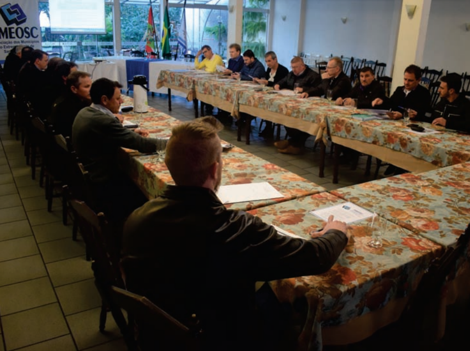
31 de julho de 2018