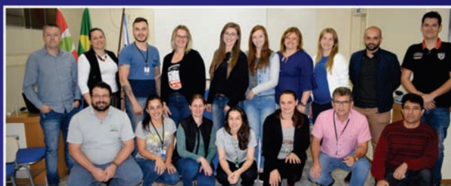
Reunião do Colegiado de Recursos Humanos