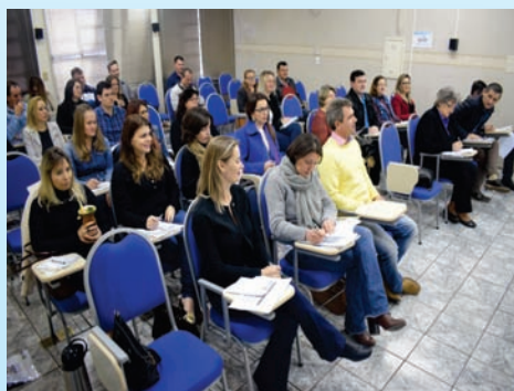
Capacitação sobre Estágio Probatório