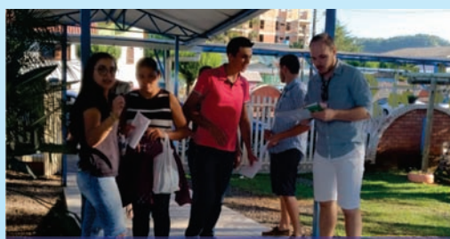
Recepção dos Candidatos