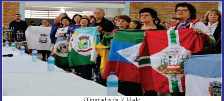
Olimpíadas da 3ª Idade