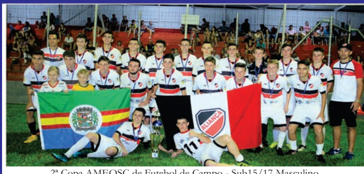
2ª Copa AMEOSC de Futebol de Campo - Sub15/17 Masculino