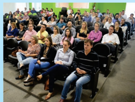
Capacitação Betha Sistemas