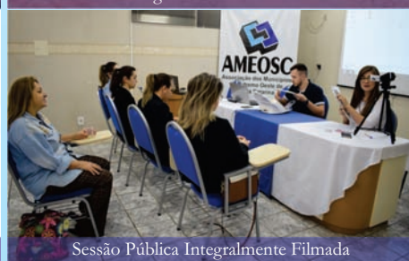
Sessão Pública Integralmente Filmada