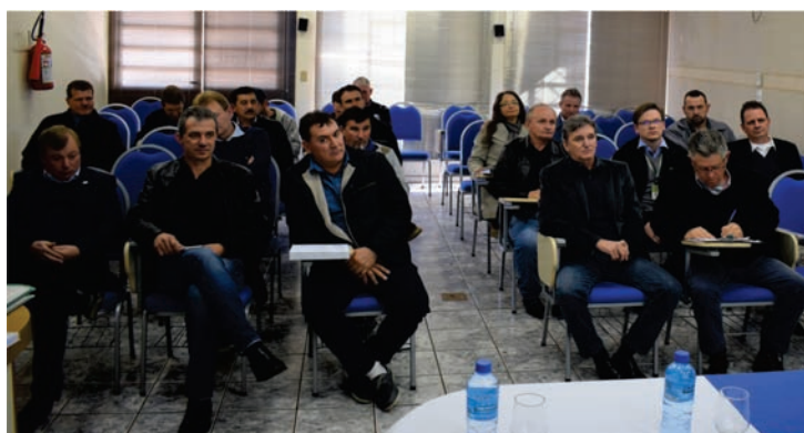
12 de julho de 2018