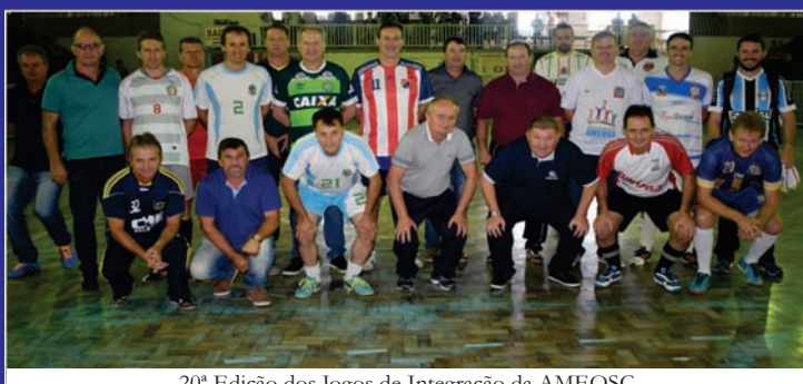
20ª Edição dos Jogos de Integração da AMEOSC