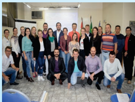
Capacitação sobre Normas Internas