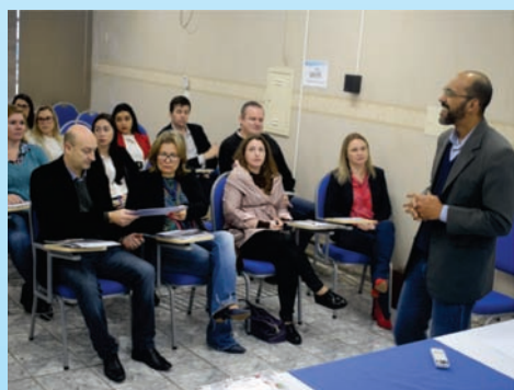
Capacitação sobre Sindicância