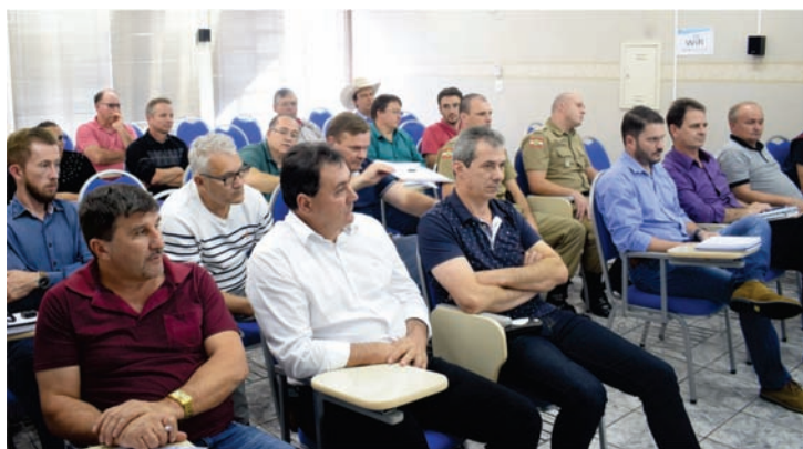
25 de maio de 2018

Nas assembleias de 2018, estiveram em pauta assuntos como a avaliação dos serviços prestados, a nova sede da AMEOSC, cujo terreno foi doado pela Prefeitura de São Miguel do Oeste; encaminhamentos administrativos devido à paralisação do sistema de transporte rodoviário e as manifestações das categorias envolvidas; o serviço de oncologia no Hospital Regional, entre outras pautas regionais.