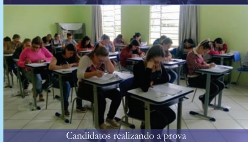
Candidatos realizando a prova