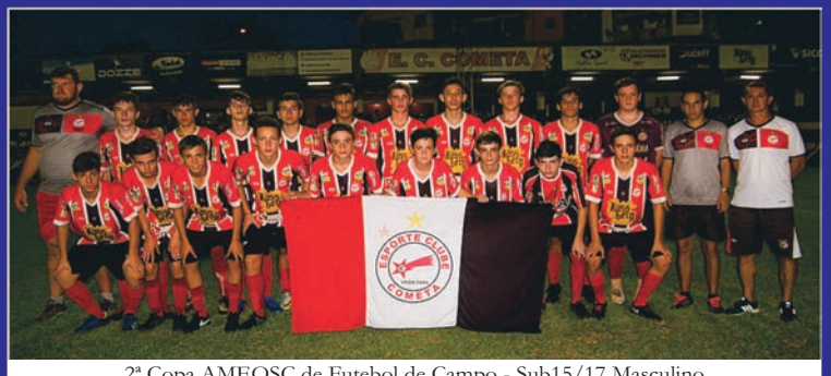
2ª Copa AMEOSC de Futebol de Campo - Sub15/17 Masculino