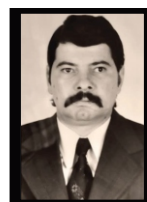
CLADIR DE GRANDÓ 1984 | São José do Cedro